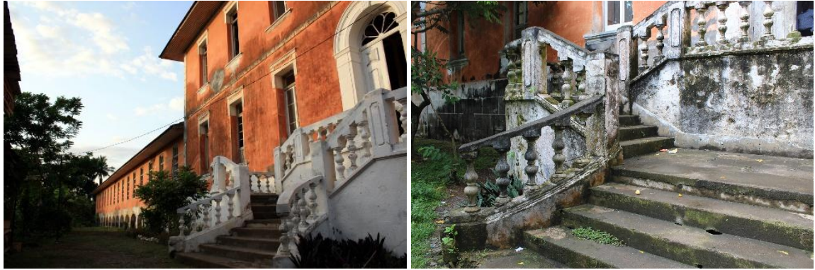
Fotografias da fachada principal da Roça 2014