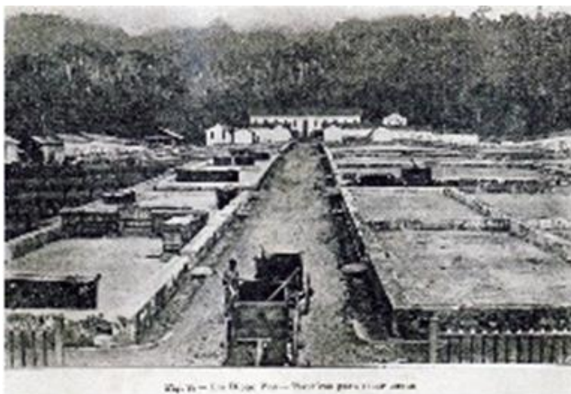
Fotografia antiga dos secadores de café na Roça Diogo Vaz

A Roça Diogo Vaz possuía autonomia total e todos os equipamentos disponíveis, à época, inclusive, porto próprio. Organizada em socalcos, possuía estrutura de “comboio”, a que os equipamentos se iam acoplando sucessivamente, com uma grande avenida central (roça-avenida). As sanzalas desenvolviam-se ao longo dos socalcos com terreiros próprios. Nesta roça existia uma total separação entre os edifícios destinados a habitação e os equipamentos (secadores, armazéns, oficinas e hospital).