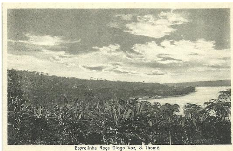
Espreilha Roça Diogo Voz, S. Thomé.

Com o desenvolvimento destas culturas começam a surgir as primeiras roças – estruturas agrárias do café e do cacau em São Tomé e Príncipe, que durante séculos da sua história deram origem a períodos gloriosos de produção agrícola e desenvolvimento económico. A palavra roça significa “desbravar mato”, “abrir clareiras” ou “terreno onde se roçou o mato”. A criação destas estruturas tem algum paralelismo com os engenhos de açúcar e as fazendas no Brasil, que iam alargando a área de cultivo necessária ao mercado consumidor.