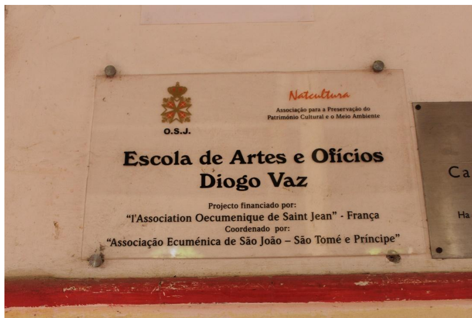
Fotografias do edifício do hospital da Roça Diogo Vaz - abril 2018