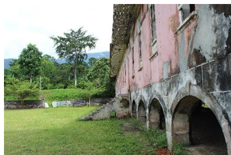
Esquema de construção de um edifício de hospital das roças de São Tomé fotos - abril 2018

De planta retangular com um corpo central (de dois pisos) e duas largas e amplas alas (de um piso e correspondentes às enfermarias, masculina e feminina), surge imponente num patamar de cota superior. Possui um terreiro, em frente à fachada traseira, e um jardim privativo, em frente à fachada principal. Este imóvel é um bom exemplo de que o hospital era, regra geral, o edifício de maior destaque na maioria das roças, quer pelo seu tamanho e nobreza, quer pela sua localização, (no ponto mais alto da roça).